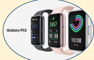
三星Galaxy Fit3 健康智慧手環 (售價:$2,680)