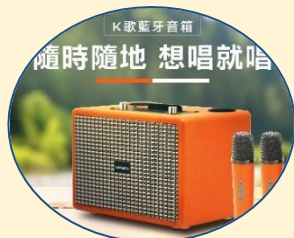
日本愛華藍牙K歌音箱 (售價:$2,980)