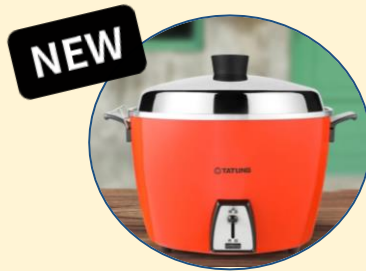
大同10人份電鍋 (售價:$3,390)